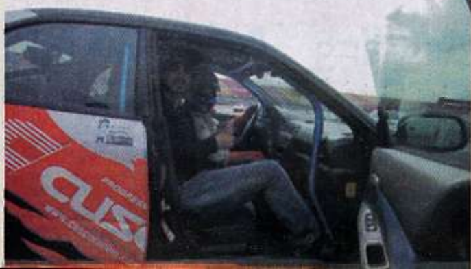
本刊代表受邀觀摩JGTC車手駕駛絕技。