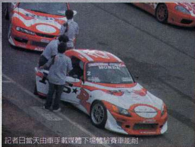
記者日當天由車手載媒體下場體驗賽車能耐。