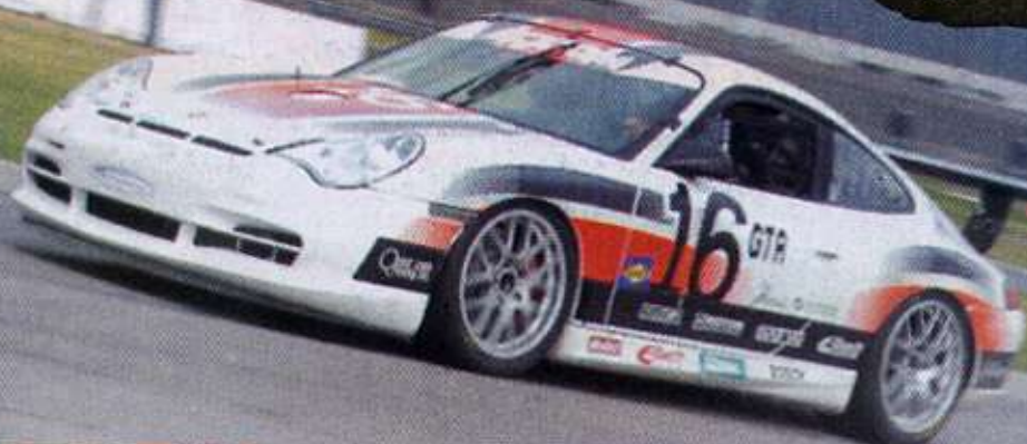
JGTC賽車種類繁多，囊括歐、美、日等各類車款。