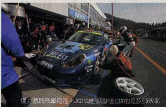
場上激烈飛車追逐，JGTC維修區內比拼的是技師效率。